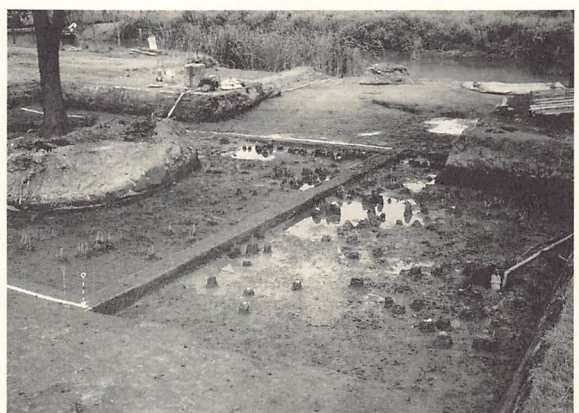
L地区遺物出土状況