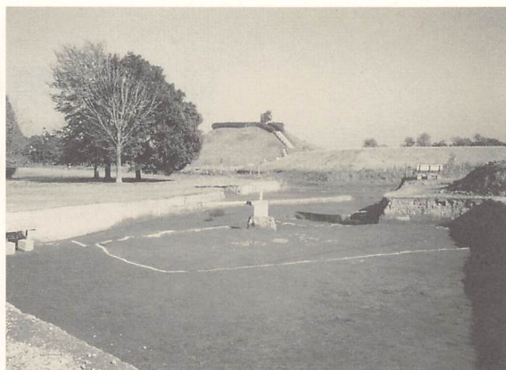
M地区遺物出土状況

P・Q地区は前方部南部の周堀プラン（剣菱形）の検証と3区外堀コーナーからの繋がり及び1