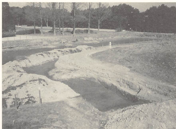
N地区遺物出土状況