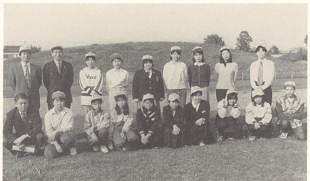
委嘱式後のボランティアたち

埴輪や勾玉の製作、七夕馬やワラジづくり、綿くりの体験など、当館の特色である考古及び民俗に関する体験活動的なボランティア活動の場を青少年に提供し、ボランティア精神を培うとともに、地域の史跡・文化財等を大切にする心を培い、豊かな人間性を育むことを目的とした。