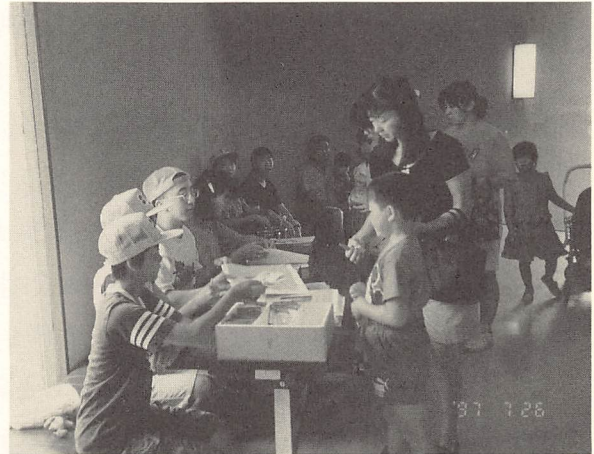
活動するボランティアたち