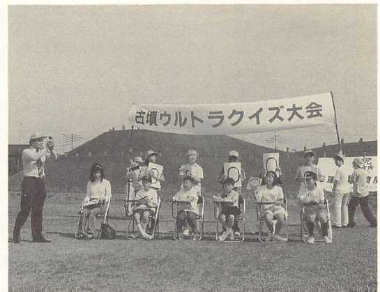
古墳ウルトラクイズ大会を運営するSJV