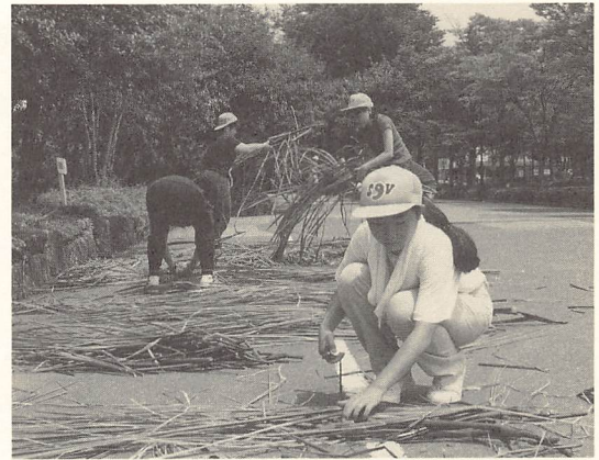
「七夕馬をつくろう」の準備をするSJV