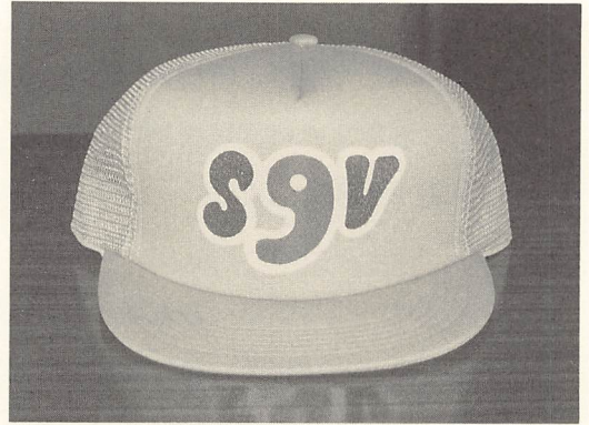
さきたま青少年ボランティア帽子