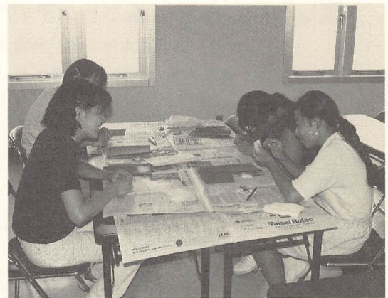
勾玉作りを体験するSJV