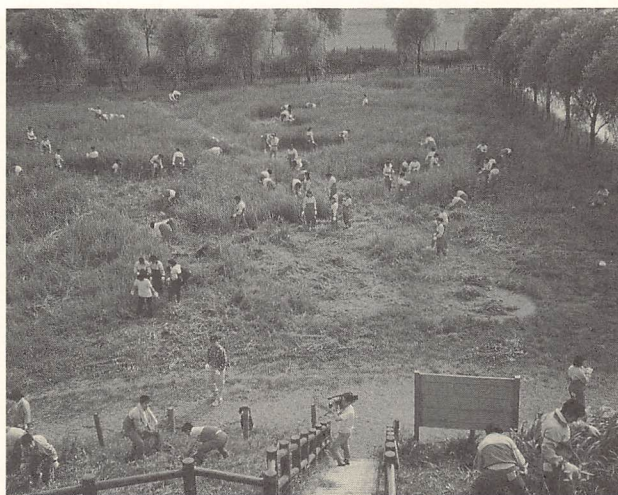
除草ボランティアに取り組む生徒たち

昨年度6月、市内の中学校（行田市立忍中学校）と連携を図り、「埼玉古墳群除草ボランティア」を受け入れた。生徒会活動のJRC（青少年赤十字）委員会の呼びかけに、土曜日の午後、なんと221名もの生徒が参加し、稲荷山古墳の前方部を中心に、丸墓山古墳の周囲等の除草に取り組んでくれた（次ページの新聞記事参照）。なお、学校側のねらいは次の通りであった。