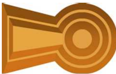
ぜんほうこうえんふん 前方後円墳