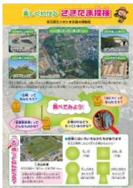
子ども向けパンフレット 「楽しくわかる さきたま探検」 (さきたま史跡の博物館HPで見られます)