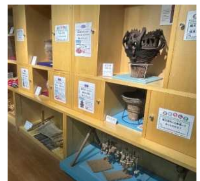
さいきたまたいけんこうぼう さきたま体験工房 (さきたま史跡の博物館)