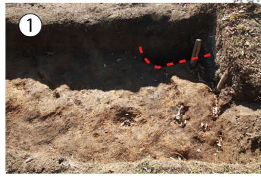
1トレ西端のピット