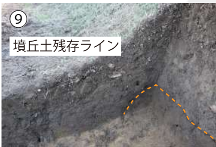
墳丘土残存ライン