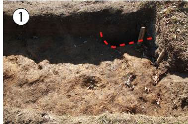
1トレ西端のピット