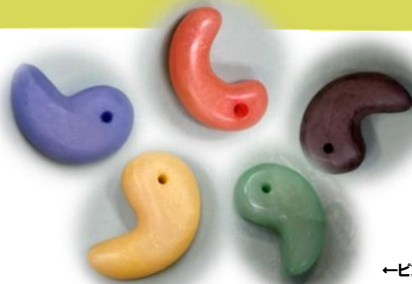
←ピンクの石・3分で実施