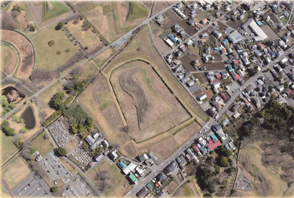
埼玉二子山古墳全景