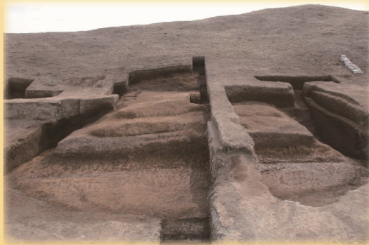
埼玉二子山古墳 墳丘造出し