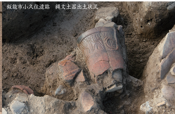
飯能市小久住遺跡 縄文土器出土状況