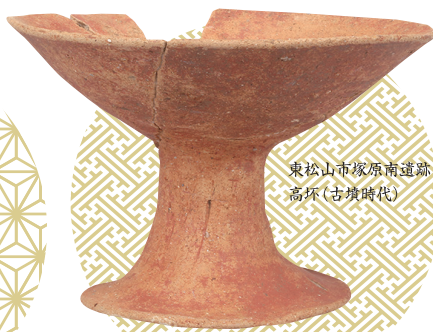
東松山市塚原南遺跡 高杯(古墳時代)