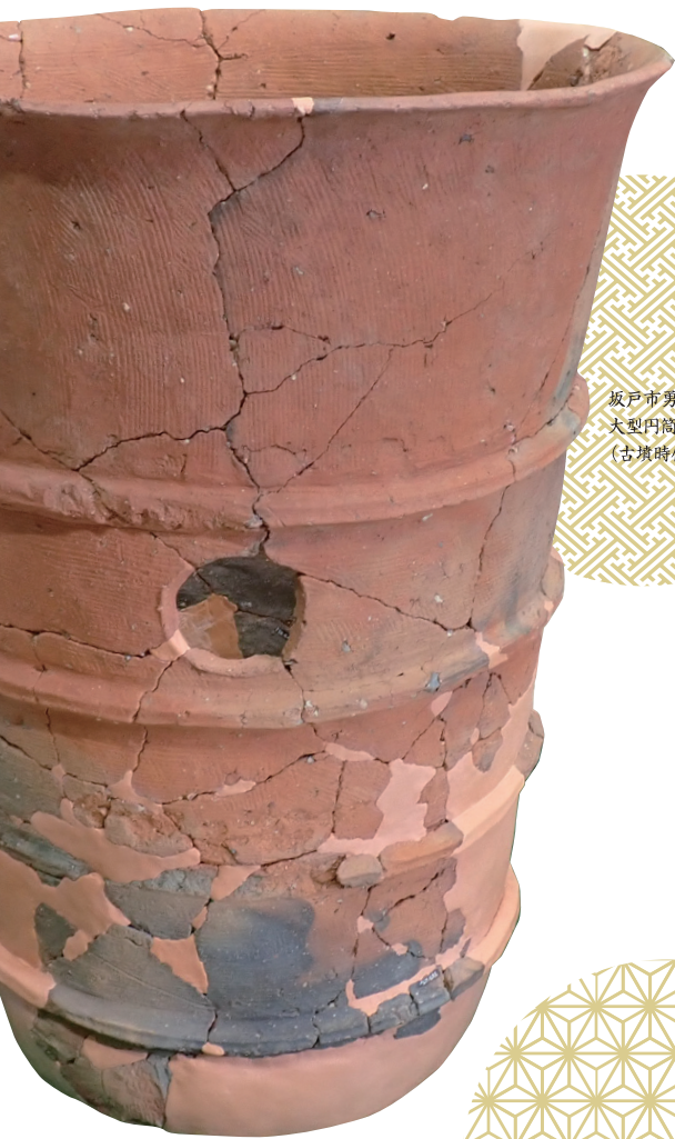
坂戸市男稲奇遺跡 大型円筒地輪 (古墳時代)