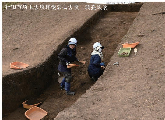
行田市埼玉古墳群愛宕山古墳 調査風景