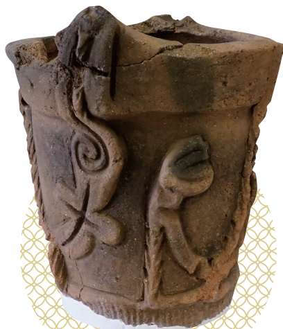
所沢市懸棚遺跡 深鉢(縄文時代)