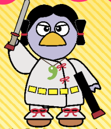
埼玉県公式マスコット コバトン